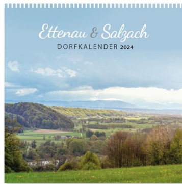
Format 30 x 30 cm - 14 Seiten - weiß spiralisiert Rückblatt aus Graukarton

Der Kalender ist limitiert, kostet €12,- und ist in St. Radegund im Café/Bäckerei s' Rodegona, am Gemeindeamt und bei Obfrau Eva Peterlechner erhältlich.